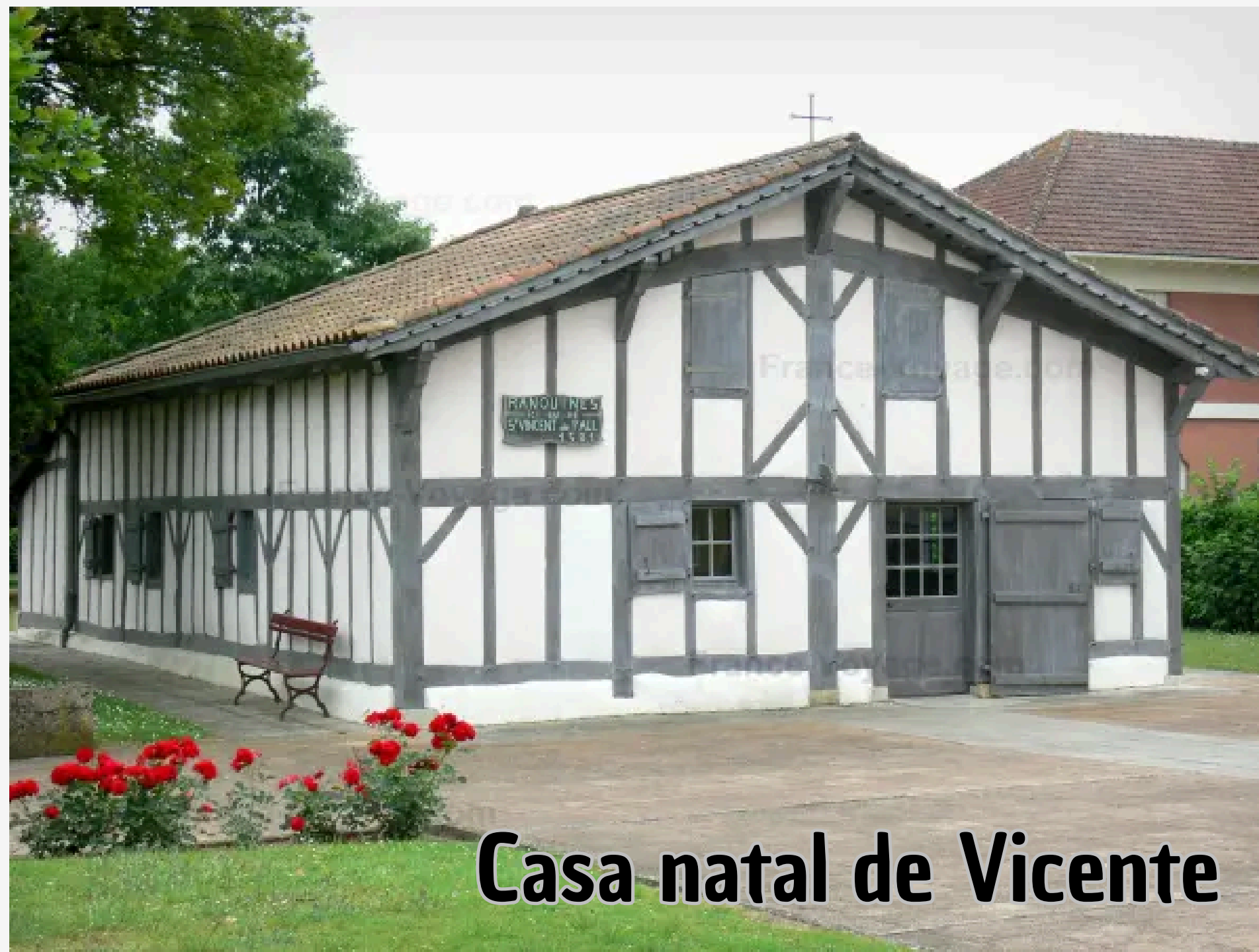
Casa natal de Vicente